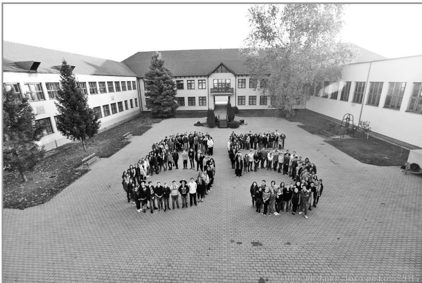
Hunyadi János Középiskola 2017