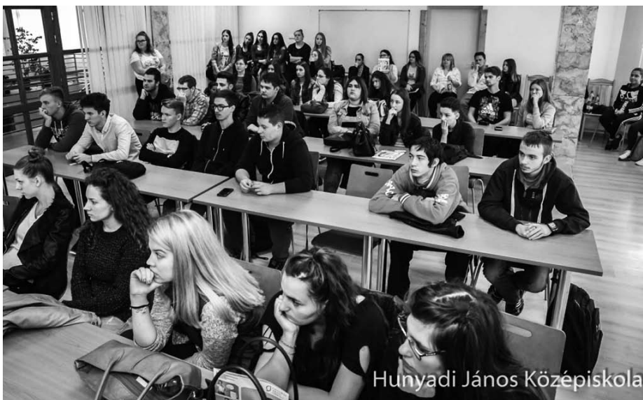
Hunyadi János Középiskola

Iskolánk hálás szívvel mond köszönetet minden szakmai partnerünknek, érdeklődőnek, kollégáinknak és diákpolgárainknak, minden iskolánkba látogató vendégnek. Szeretettel vár Mindenkit a 65 éves Hunyadi, a tudás vára.