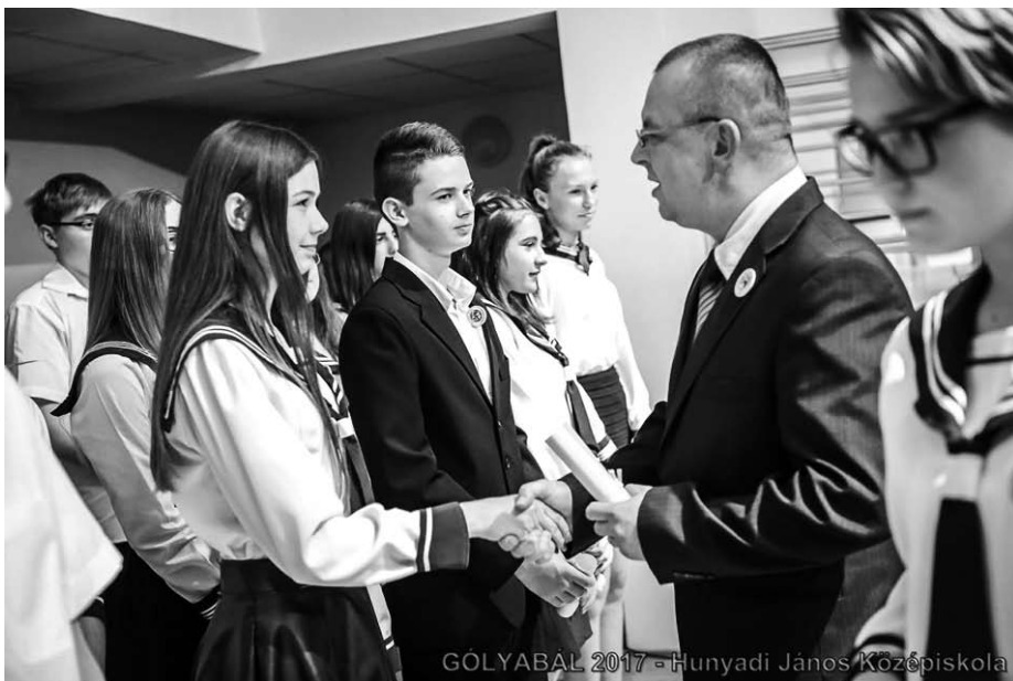
GÓLYABALI 2017 - Hunyadi János Középiskola

Az est megnyitása után a 10. B osztály által írt forgatókönyv szerint megrendezett és színpadra vitt előadást láthattak a nagyérdemű, amelyben nem volt hiány táncból, házirendből és zenéből, de még egy új Kasszás Erzsémitátor is született a műsor során. Mindezek mellett gólyáink mindennapjait, a mára már divattá vált szelfiket, az évnnyitó és a gólyaavatás képeit is megcsodálhatták a nézőtérben. A mintegy félórás előadás után tették le a két hónapos küzdelmet megkoronázó gólyaesküt a nebulók, amelyben örök hűséget fogadtak a tizedik évfolyamnak.