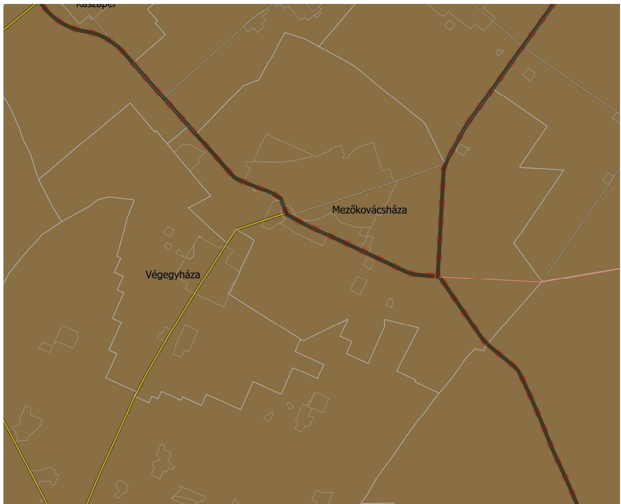
BMTTrT 4/10. melléklet: ásványi nyersanyagvagyon övezete