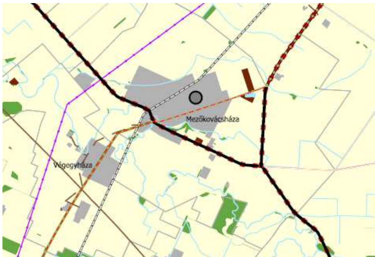
BMTrT 1. melléklet: Békés megye szerkezeti terve